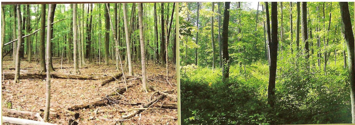
Figure 2. La photo de droite montre une forêt mature qui n'a pas encore subi une coupe sélective et la photo de droite, montre la même forêt qui a subi une coupe forestière sélective (Thomas 2006, p.20).